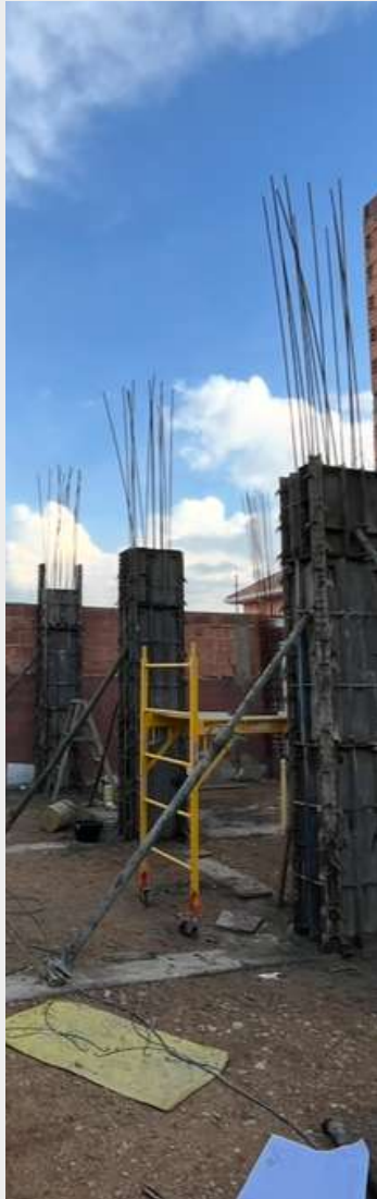
ESTRUCTURAS EN CONCRETO