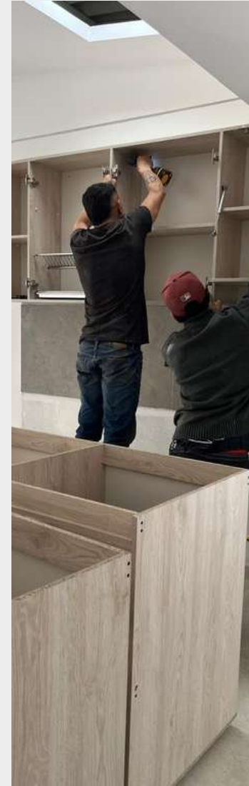
CARPINTERÍA DE MADERA