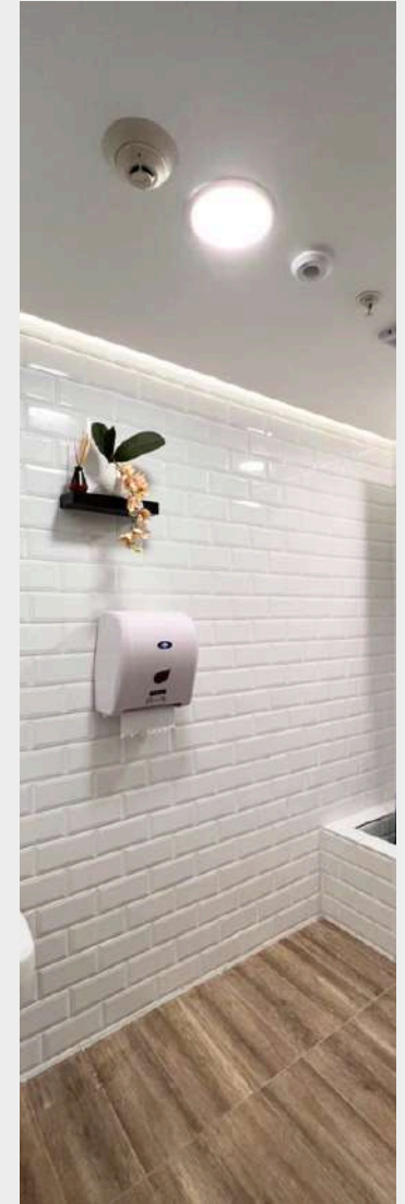
SENSORES DE HUMO